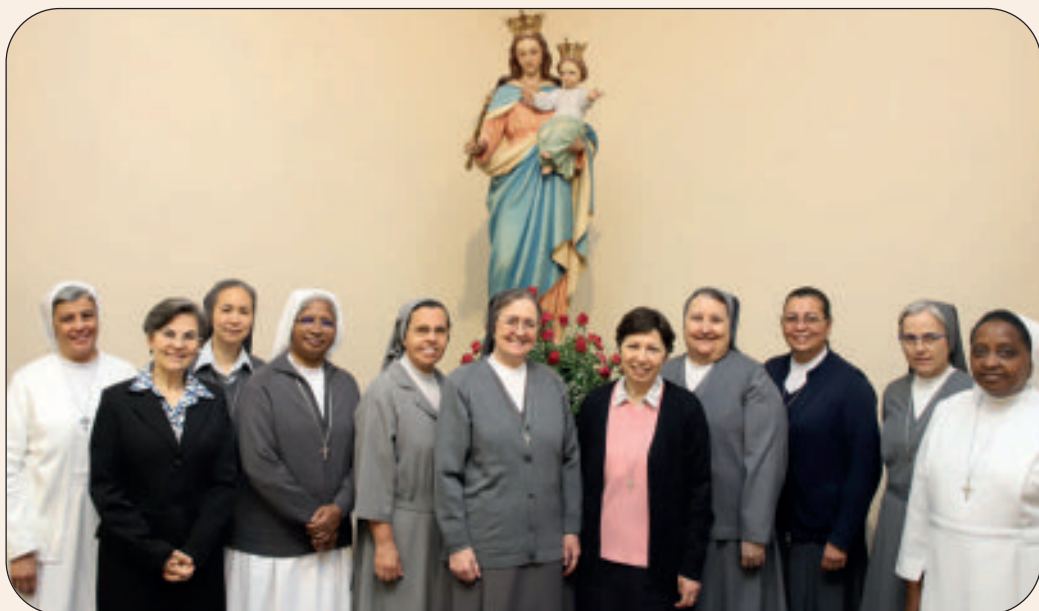
Alcuni membri del nuovo Consiglio generale. Otto di essi sono ex alunne della Facoltà

implicate dallo spazio pubblico e della socialità umana in un'opera comune di apertura del mondo.