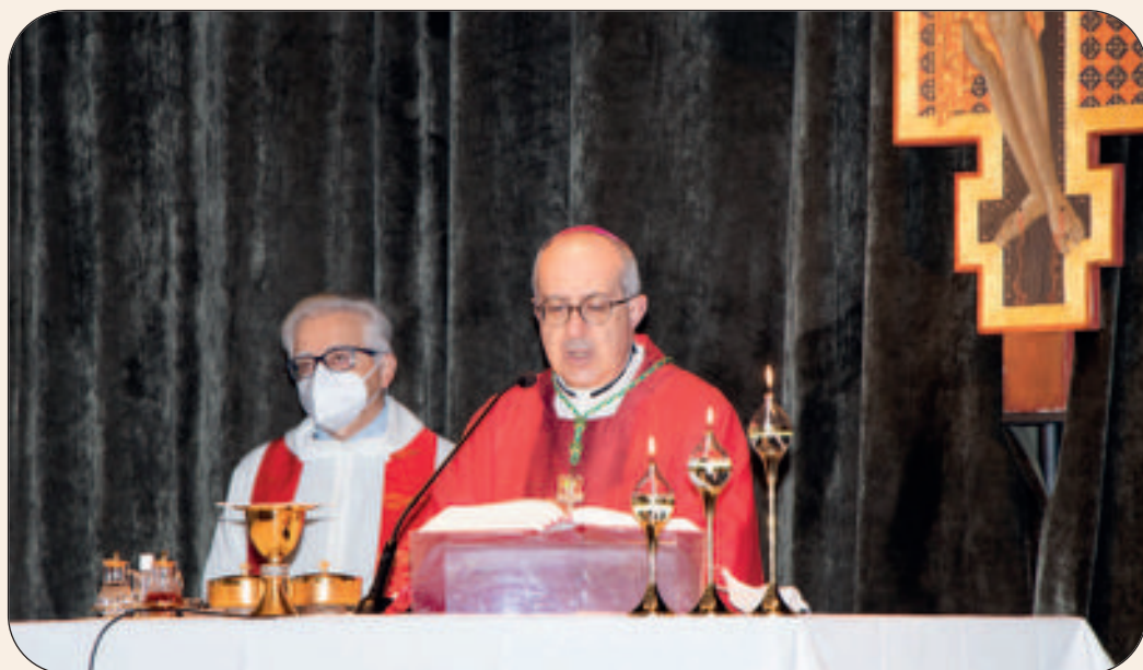
Mons Gianrico Ruzza, vescovo di Civitavecchia e Amministratore apostolico della diocesi di Porto-Santa Rufina

L'atto accademico si apre alle ore 9.00 con la celebrazione Eucaristica presieduta dal Vescovo mons. Ruzza che esprime il suo apprezzamento per la presenza sul territorio della diocesi di una Facoltà dedicata allo studio delle scienze dell'educazione. Nell'omelia riflette sulla realtà della ricerca come atto di amore spirituale, intellettuale e relazionale. Sollecita, in particolare i nu-