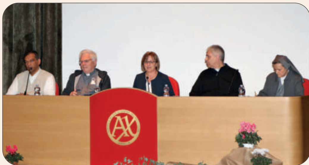
I membri della Commissione esterna di qualità